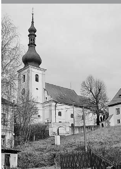
Brod nad Tichou