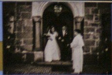
...a i pro požádání svatosti